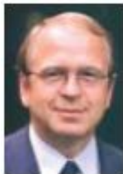
Erkki Liikanen, Member of the European Commission responsible for Enterprise and Information Society