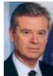
David Byrne Member of the European Commission responsible for Health and Consumer Protection